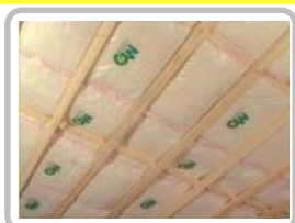
【屋根・天井の断熱改修】